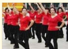
大妈纽约跳广场舞被铐 中西文化差异引热议