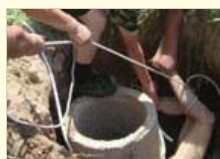
爷爷为救坠井孙子倒挂一夜身亡