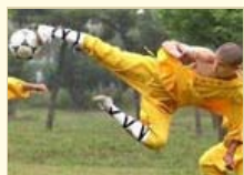
登封惊现“少林足球” 少林寺回应：跟我没关系