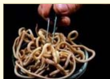
蛔虫减肥法网上遭热捧 专家：能减肥但更伤身