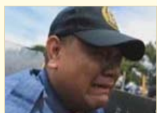
哭泣警察：菲律宾警察被游客骂至崩溃痛哭