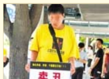
“卖丑哥”街头卖丑 炒作只为筹钱整容