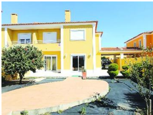
葡萄牙海滨度假胜地卡斯凯什一栋“地处安静尊贵区域”的315平方米独栋别墅售价67.2万欧元