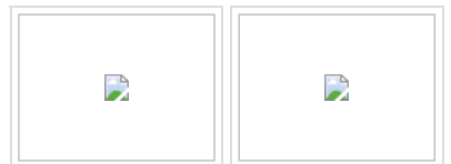
普京送钱送天然气拉拢乌 默克尔再任德总理(图) 克兰(图)