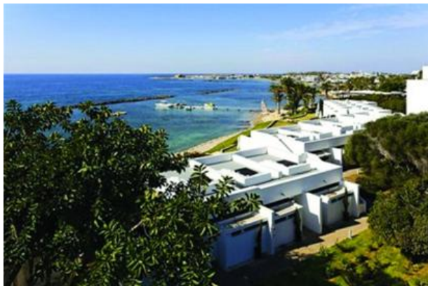
塞浦路斯西南海岸的旅游城镇帕福斯受到中国投资者青睐